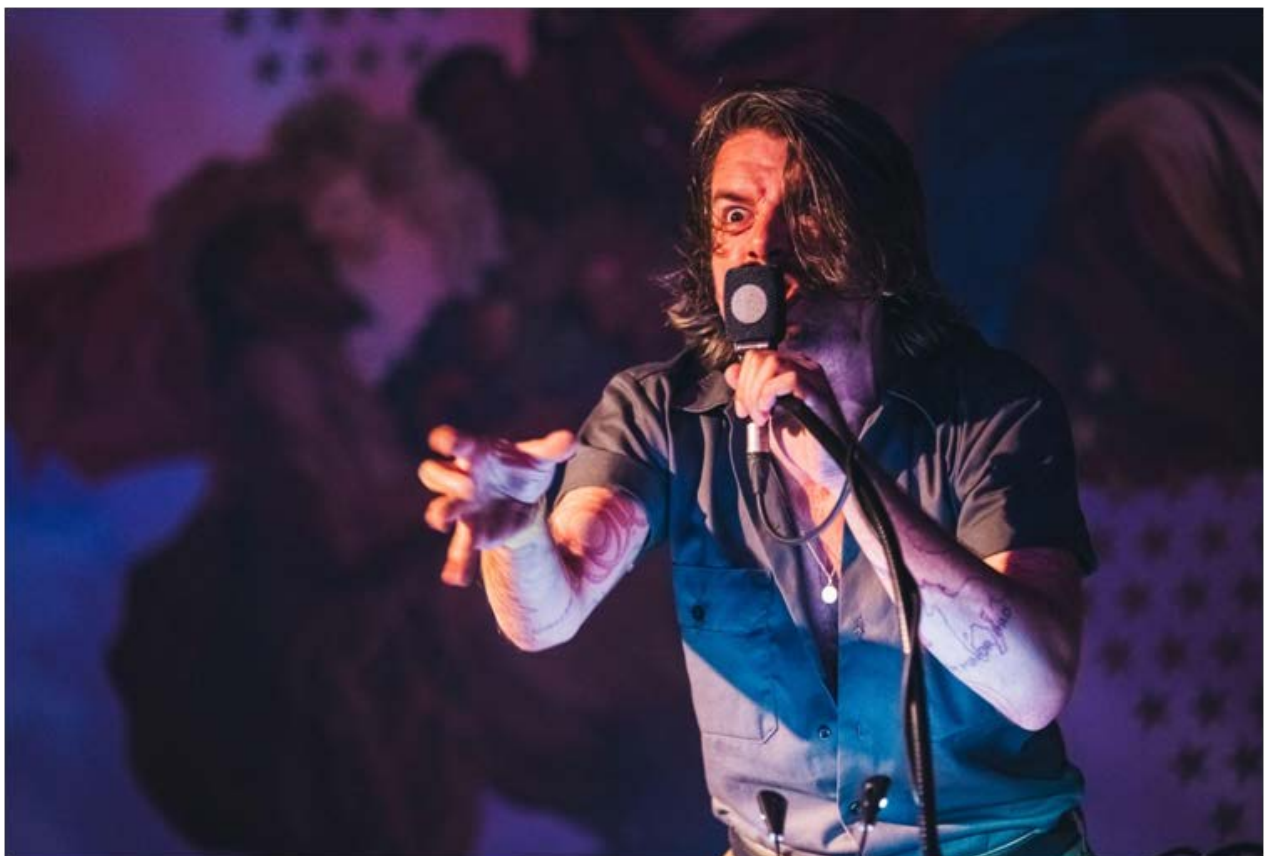
Lazer Viking (CZ) / 28.7.2023