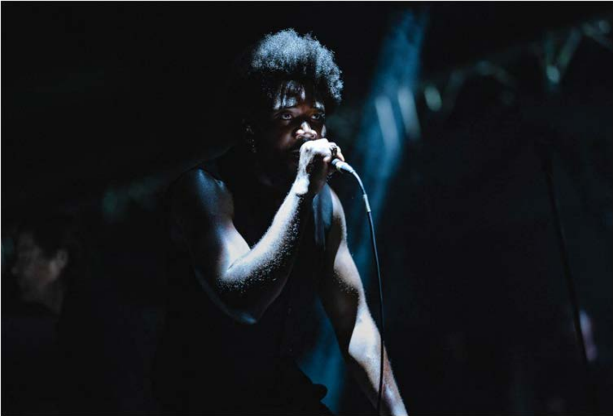
Young Fathers (UK) / 28.7.2023