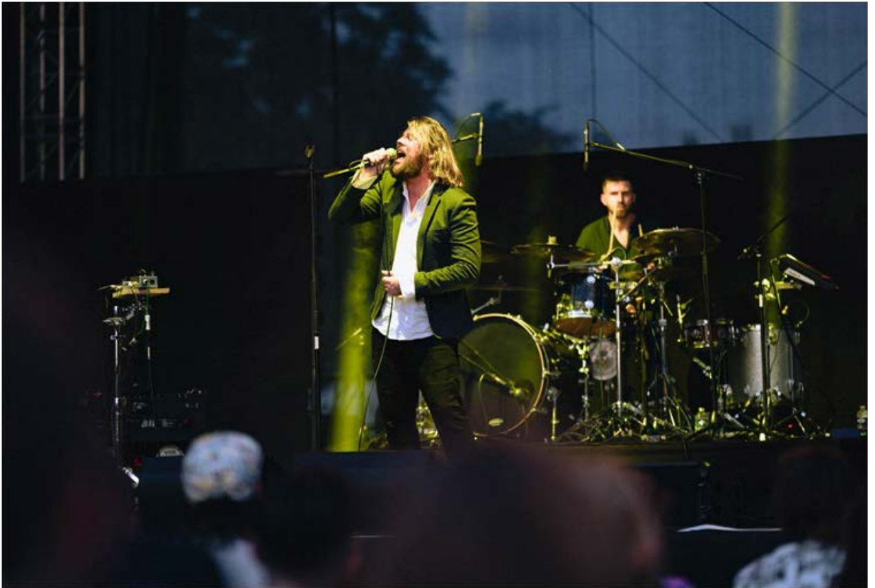
Gilla Band (IRL) / 28.7.2023