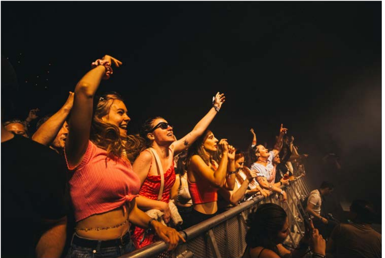
Pop Messe 2023