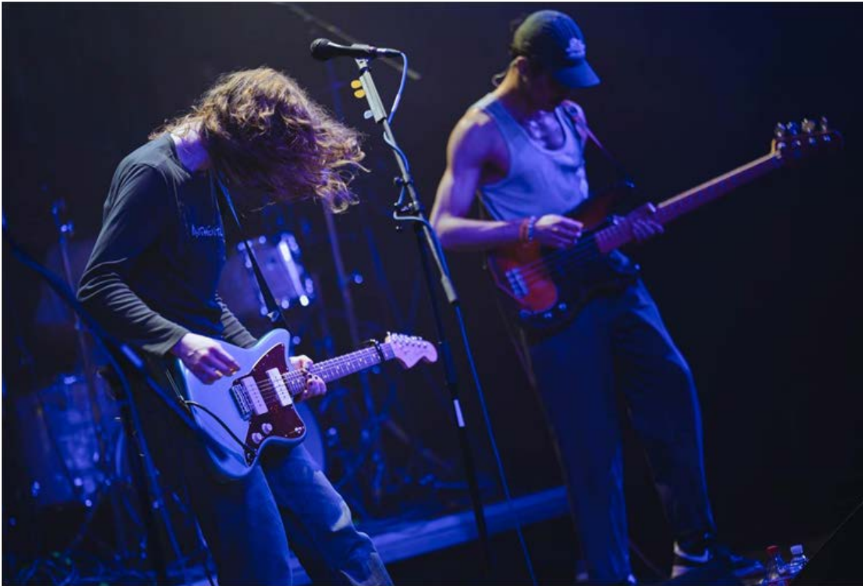
Sunnbrella (CZ/UK) / 29.7.2023