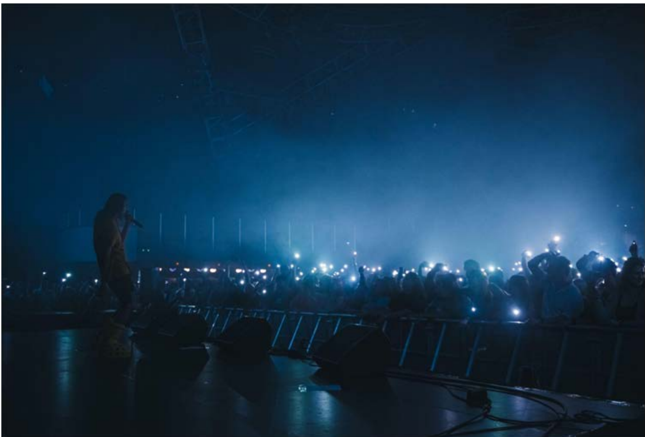
Tommy Cash (EST) / 29.7.2023