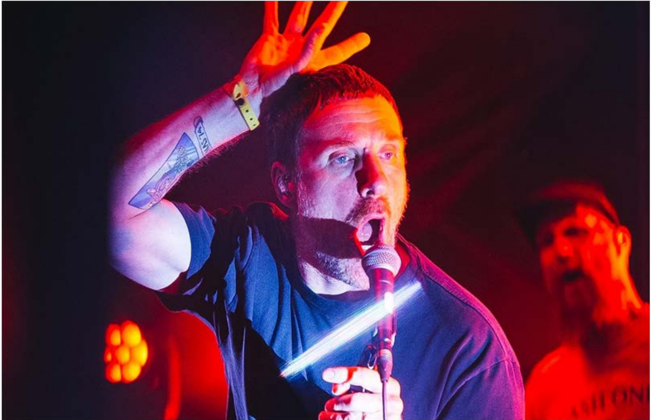
Sleaford Mods (UK) / 26.7.2024