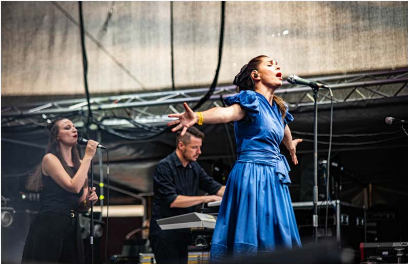
The Ecstasy Of Saint Theresa (CZ) / 25. 7. 2024