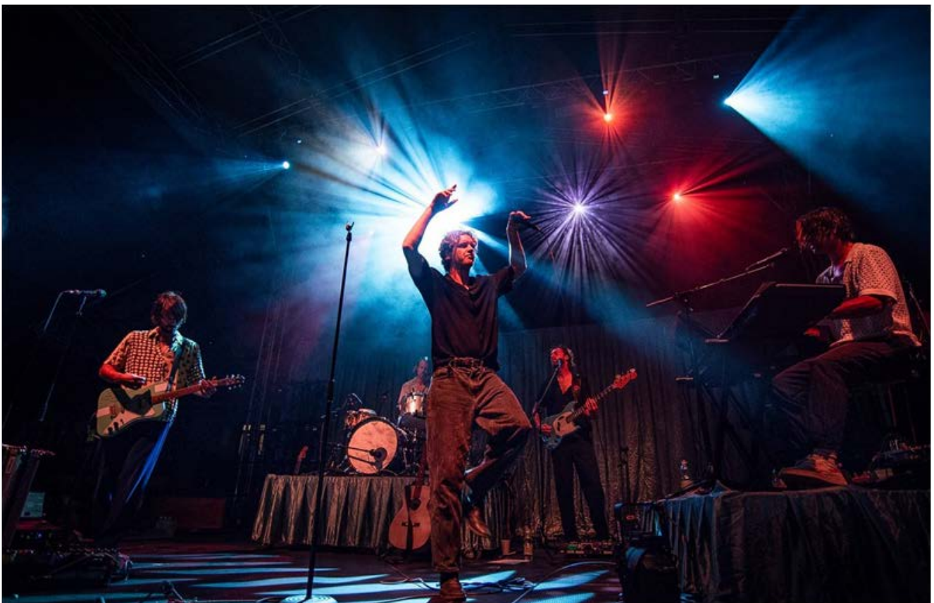
Warhaus (BE) / 27. 8. 2024