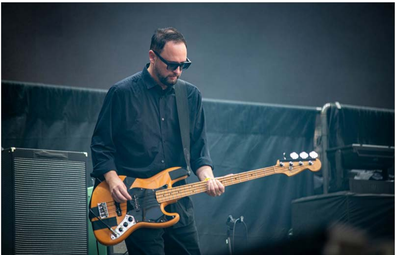
The Ecstasy of Saint Theresa (CZ) / 25.7.2024