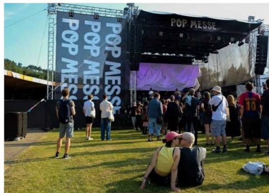
Koncert Bert and Friends na Pop Messe.

O víkendu vyvrcholil brněnský festival Pop Messe. Čtvrtý ročník přinesl nejvypracovanější a nejrozsáhlejší program ve své historii s rozmanitými hudebními žánry, které zasadil do jedinečných prostor brněnského velodromu. Ve fotogalerii přinášíme shrnutí všech tří dnů.