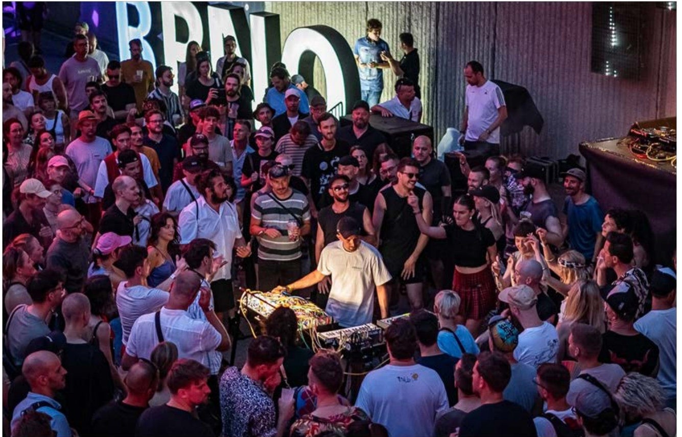
Pop Messe 2024